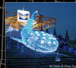
Air Swim © Hisao Tsuji

光百景アワード、WEBによる情報発信等により、「光のまちづくり」活動の内外へのプロモーションを行っています。