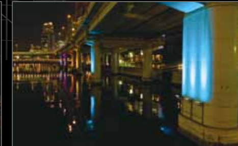
堂島川（阪神高速道路橋脚）