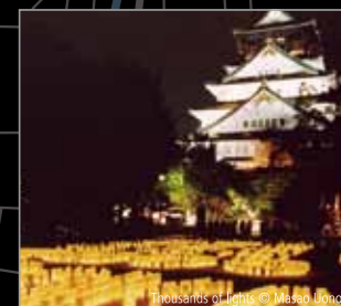
Thousands of lights