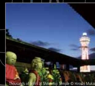
Thousands of lights at Shitennoji Temple