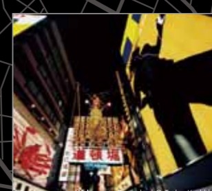
Welcome to Genshoji