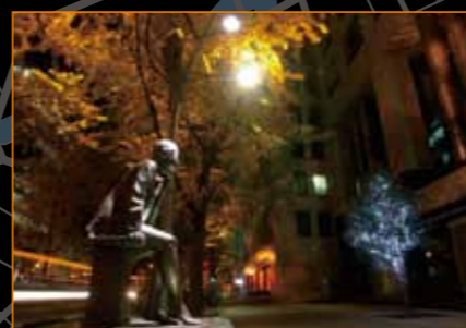
御堂筋のイルミネーション