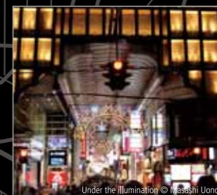
Under the Illumination © Takao Uono