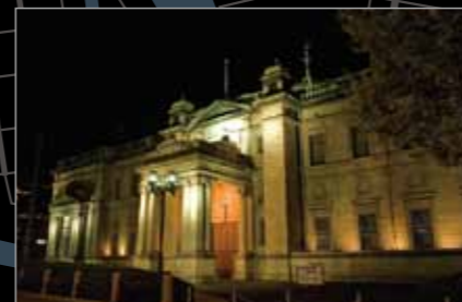
日本銀行大阪支店