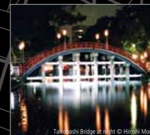
Taikobashi Bridge at night