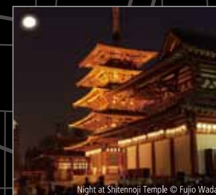
Night at Shitennoji Temple