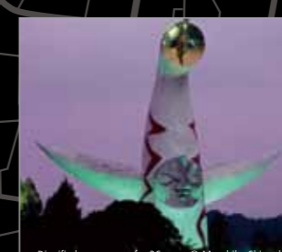
Dignified appearance for 36 years