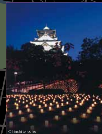
大阪城 城灯りの景