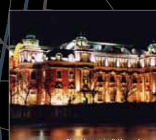
Riverside at night