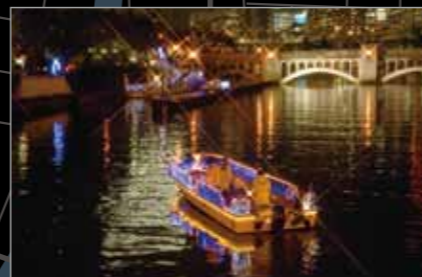
イルミネーションクルーズ